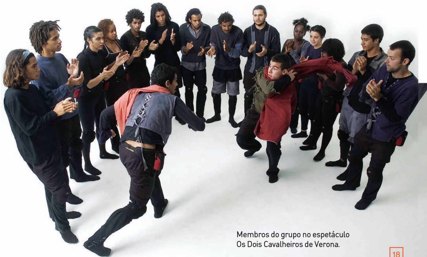
Membros do grupo no espetáculo Os Dois Cavalheiros de Verona.