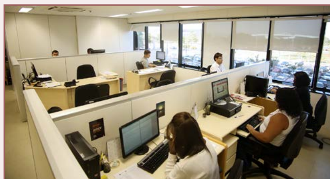
Setor de Análise da Ouvidoria